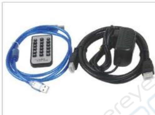
HDMI-кабель, USB-кабель, шнур камеры, пульт