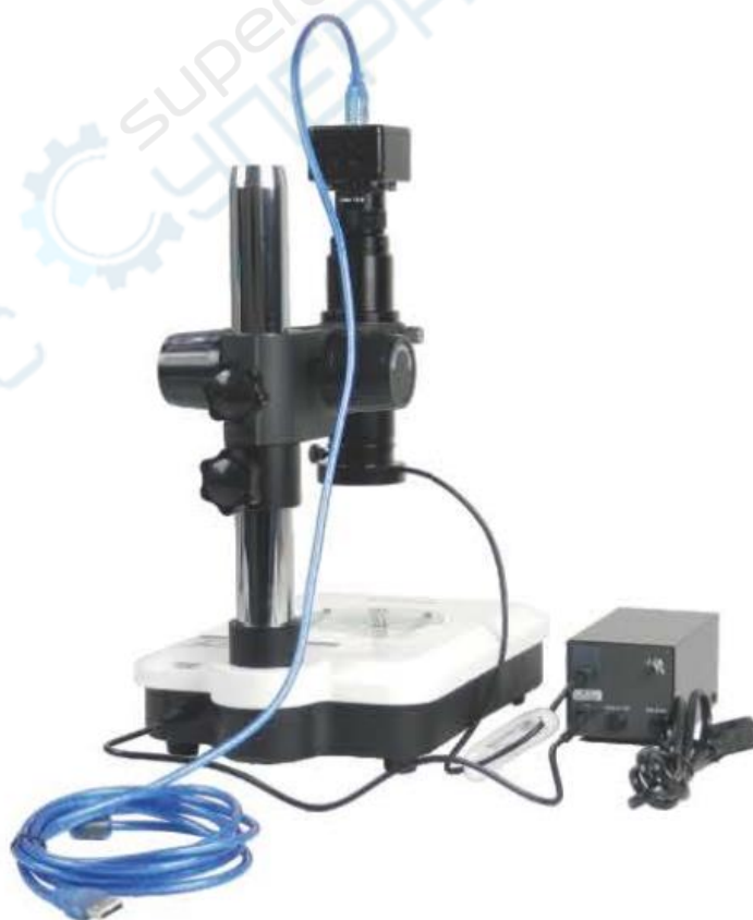
Схема подключения электрических контактов к SK2500U