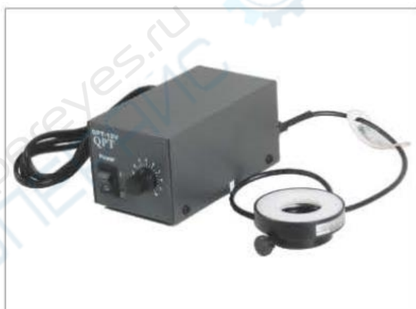
Адаптер питания лампы 12 В