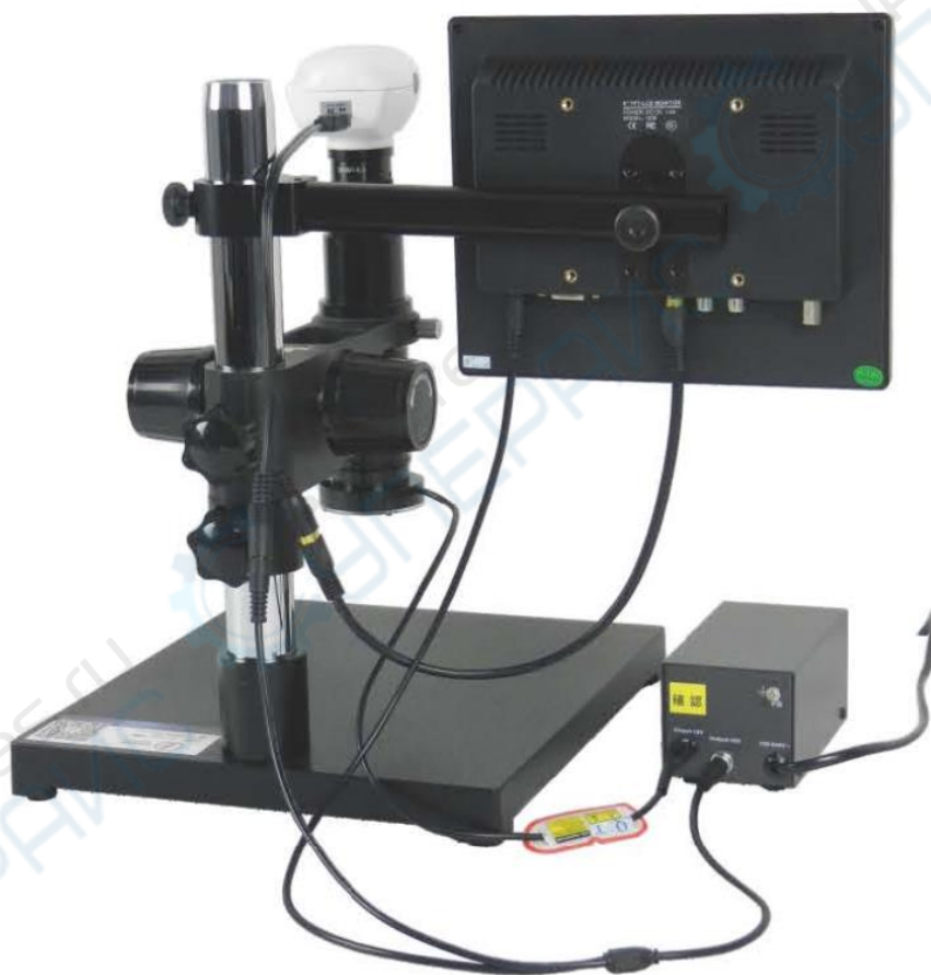
Схема подключения электрических контактов к SK2700H3