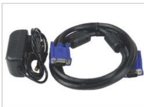
Блок питания камеры, VGA-кабель