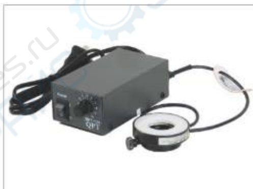
Круговая лампа и адаптер питания 12 В