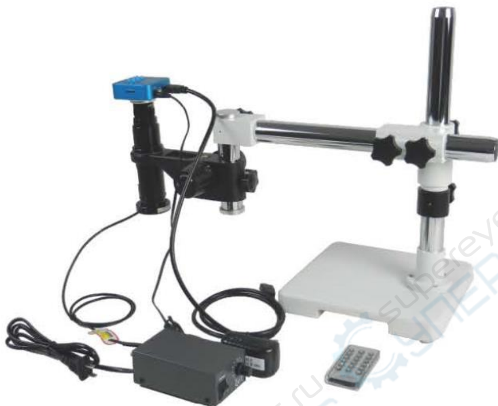
Схема подключения электрических контактов к SK-T1 (HDMI-T2)