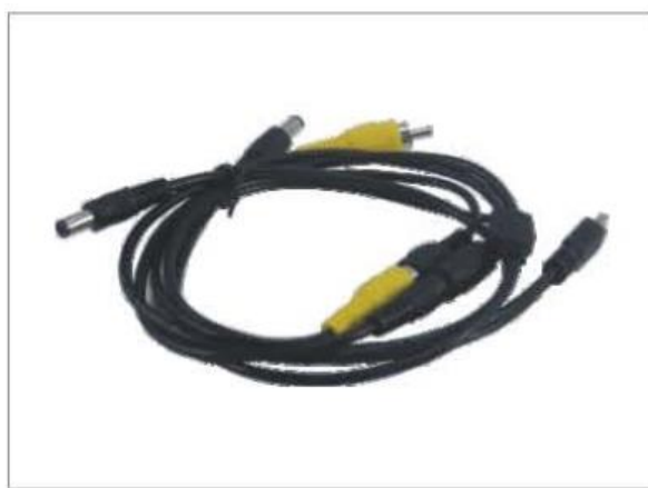
USB-кабель, сигнальный шнур, кабель питания