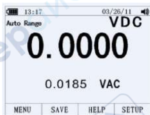
Подрежим DC AC

В режиме измерения AC– и DC–сигналов недоступны дополнительные режимы измерений: PEAK, Hz, ms, %, REL, MIN, MAX, REL.