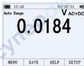
Подрежим AC + DC