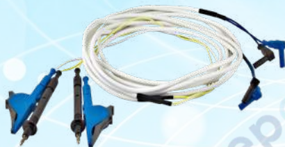
Рис. 3. Измерительные провода с раздельными токовыми зажимами типа «крокодил» и потенциальными щупами

1.12.2 Для измерения сопротивления объектов с миниатюрными контактными площадками или на неровной поверхности удобно использовать комплект измерительных проводов с двухконтактными штыревыми щупами (артикул 2002, рис. 4). Межцентровое расстояние между щупами составляет 3 мм.