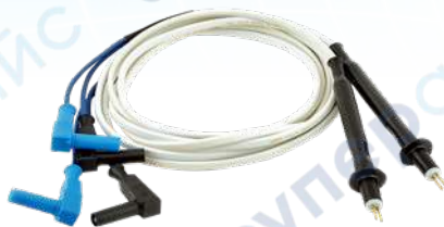
Рис.4. Измерительные провода с двухконтактными штыревыми щупами

1.12.2 Для измерения сопротивления объектов с миниатюрными контактными площадками или на неровной поверхности удобно использовать комплект измерительных проводов с двухконтактными штыревыми щупами (артикул 2002, рис. 4). Межцентровое расстояние между щупами составляет 3 мм.