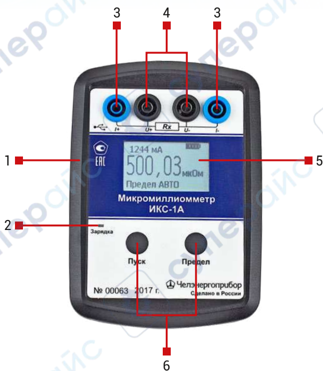
Рис. 2. Внешний вид прибора ИКС-1А