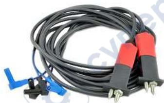
Рис.5. Измерительные провода с подпружиненным штыревым щупом

1.12.3 Для измерения сопротивления металlosвязи топливных автомобильных цистерн на АЗС, согласно предъявляемым к ним требованиям для транспортирования, оптимально подойдет комплект измерительных проводов с подпружиненными штыревыми щупами (артикул 2004, рис. 5), которые позволяют измерять сопротивление, прокалывая лакокрасочное покрытие.