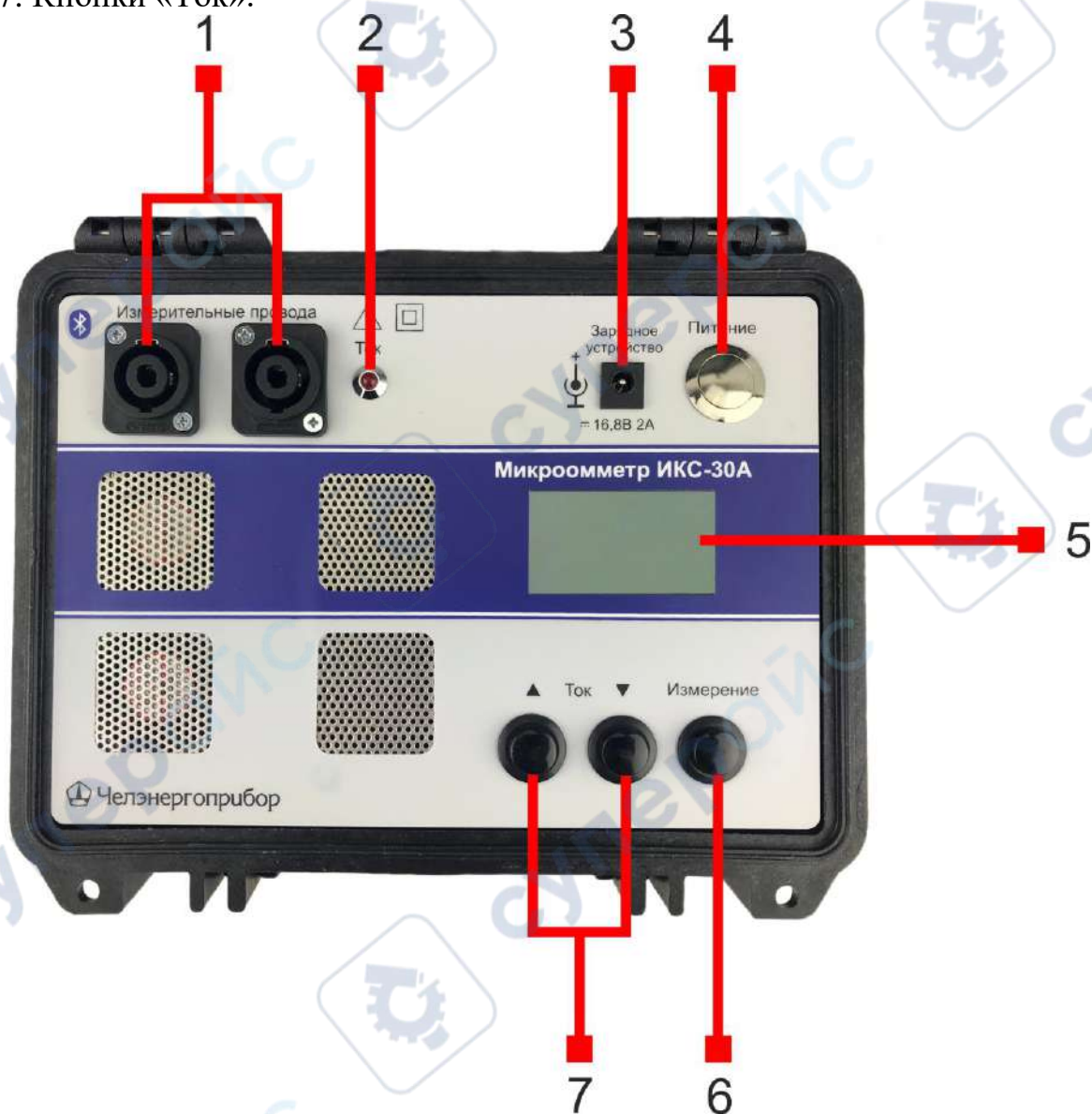
Рис. 2. Внешний вид прибора ИКС-30А

1.4.2. Включение прибора ИКС-30А производится нажатием кнопки «Питание» (4). Включается подсветка индикатора, и не более чем через 10 секунд прибор готов к работе.