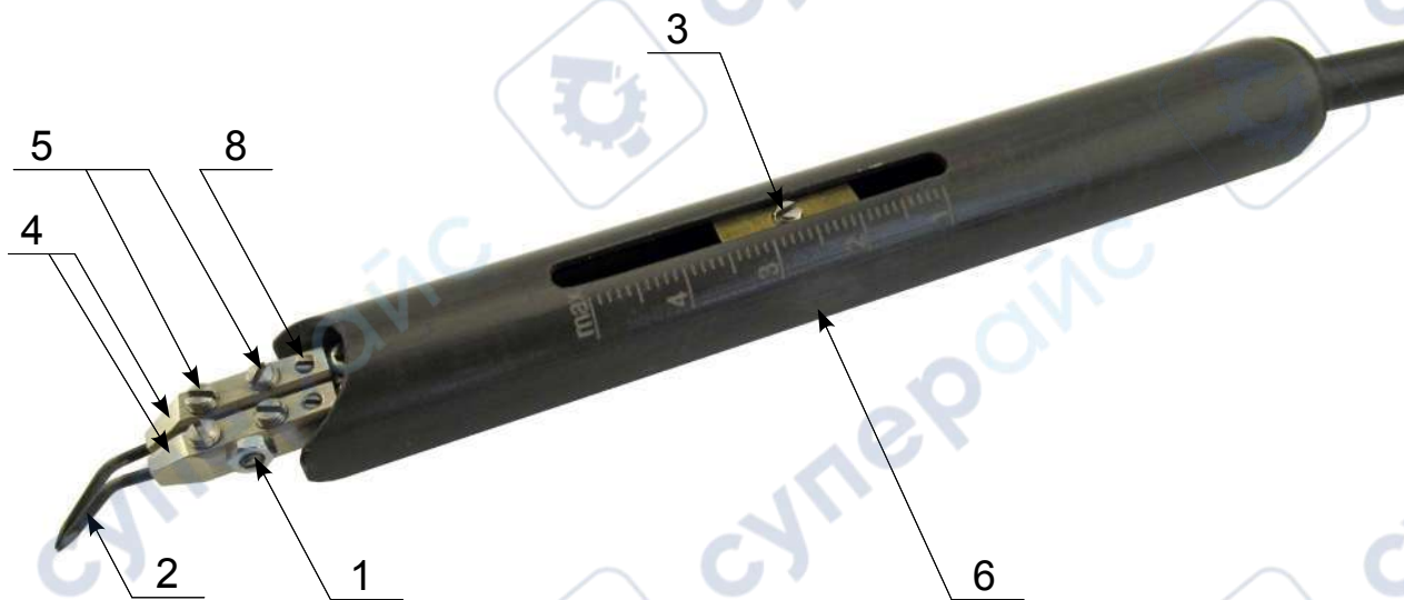
Рис. 1. Инструмент с установленным сдвоенным электродом.

1.3.2 Вид инструмента с установленным сдвоенным электродом показан на рис. 1