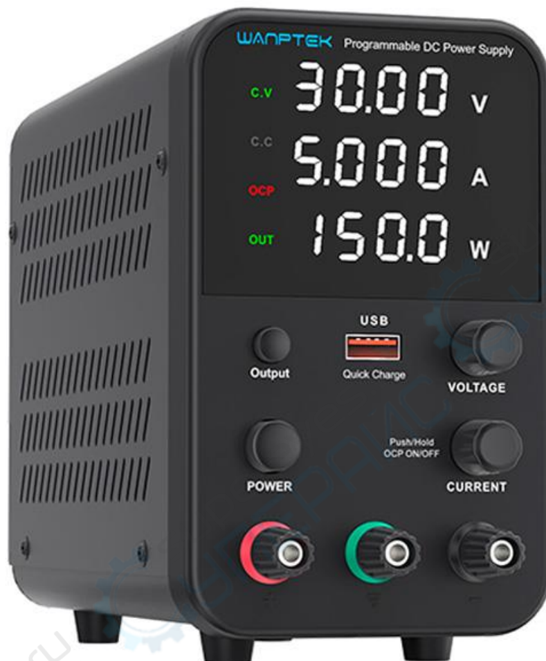
Блока питания Wanptek WPS605H