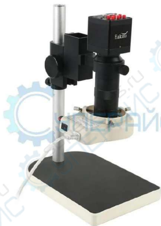
Электронный микроскоп Eakins HDMI VGA 1080p