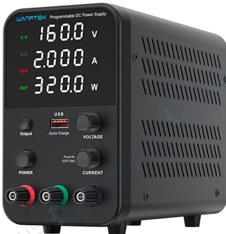
Блока питания Wanpatek WPS305H