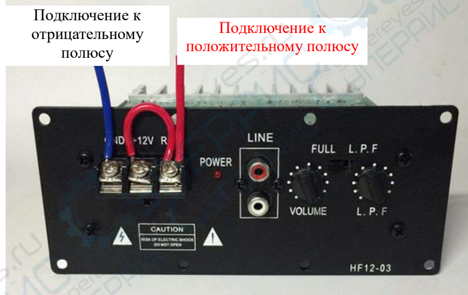
Схема подключения к клемме 12 V:

Примечание: REM и +12 V должны быть соединены. Если REM не будет подключен к +12 V, индикатор питания не будет гореть.