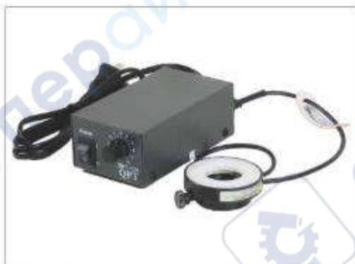
Круговая лампа и адаптер питания 12 В