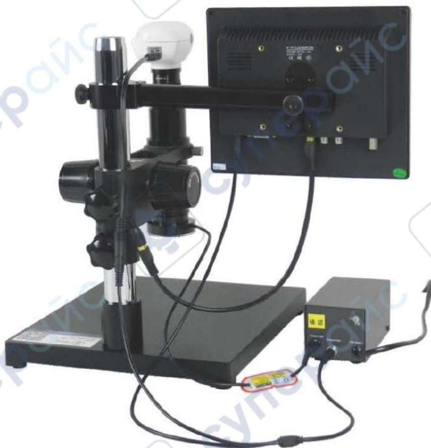
Схема подключения электрических контактов к SK2700H3