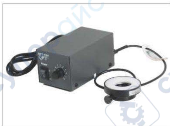
Адаптер питания лампы 12 В