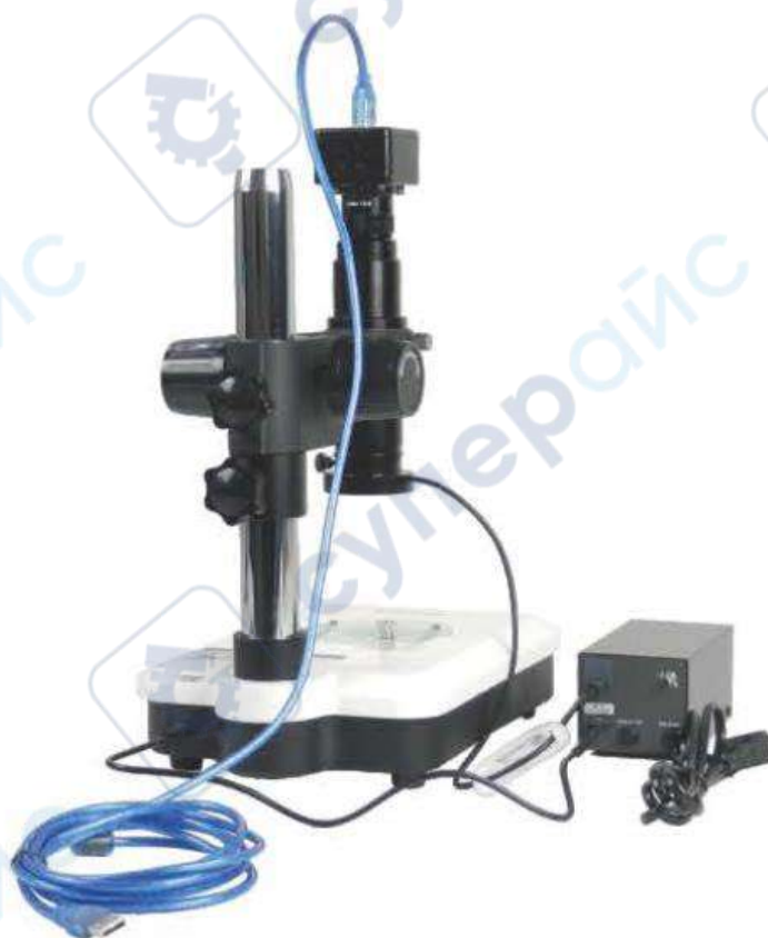
Схема подключения электрических контактов к SK2500U