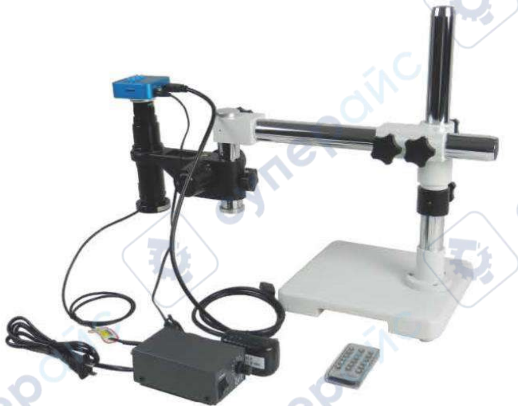
Схема подключения электрических контактов к SK-T1 (HDMI-T2)