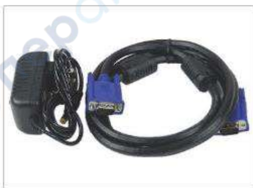
Блок питания камеры, VGA-кабель