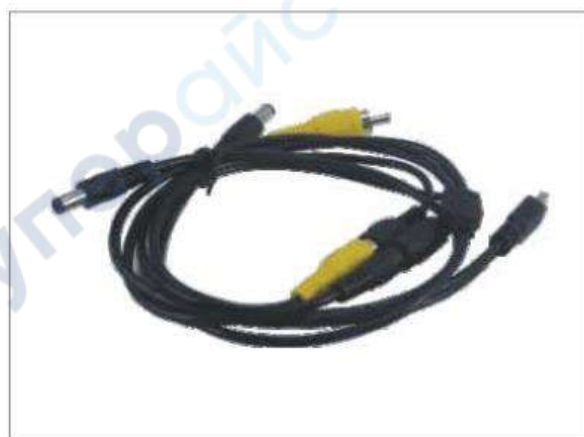
USB-кабель, сигнальный шнур, кабель питания