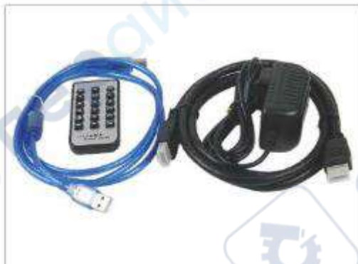
HDMI-кабель, USB-кабель, шнур камеры, пульт