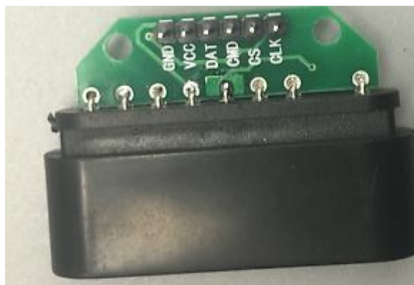
图 1- 1: 接收器引脚序号

DI/DAT:信号流向, 从手柄到主机, 此信号是一个 8bit 的串行数据, 同步传送于时钟的下降沿。信号的读取在时钟由高到低的变化过程中完成。