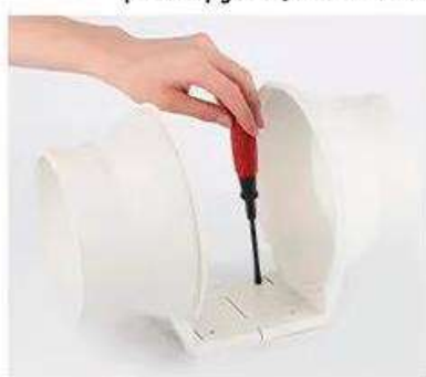
4 Зафиксируйте основание