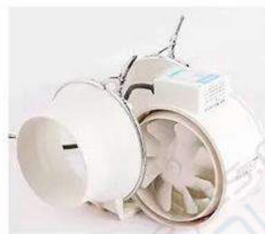
3 Извлеките основной блок