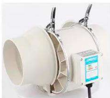
2 Отделите основной блок