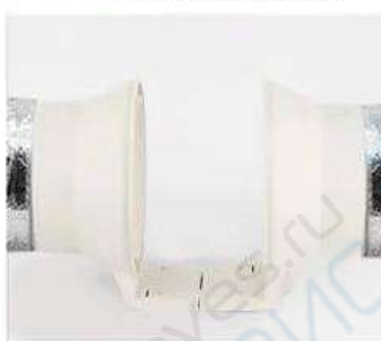
5 Произведите монтаж труб