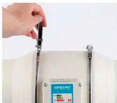
1 Потяните за фиксирующие зажимы