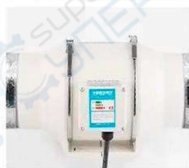
6 Верните основной блок в прежнее положение